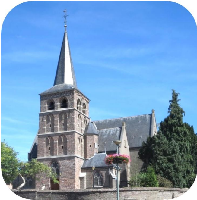
St. Antonius Abt Mook